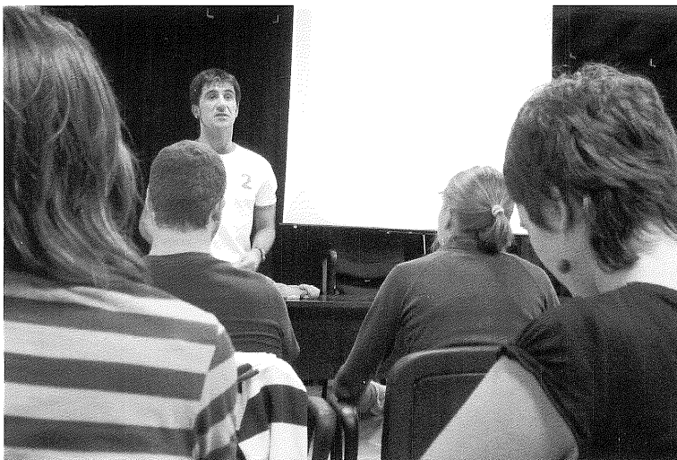
Elikagaien manipulazaiare txartela ateratzeko ikastaroa

G aztelera jasotzera ohituta gauden ikastaroak euskeraz eskaintzea da urtero egiten den ekintza honen helburu nagusia. Ekainean “elikagaien manipulazaiare txartela” ateratzeko ikastaroa egin berri dugu. Lehenengo taldea konturatu orduko bete zenez, bigarren talde bat ere osatu genuen, tabernari, begirale, jantokietako langile eta abarrek osatuta. Irailaren bukaerarako defentsa pertsonalerako ikastaro laburra antolatzen ari gara, beraz, interesa duzuenok dagoeneko izena emateko deitu dezakezue. Bukatzeko, elikadurari buruzko beste ikastaroa antolatzeko asmoa ere badaukagu udazkenerako. Beraz, adi egon, informazioa bidaliko dizuegu eta!