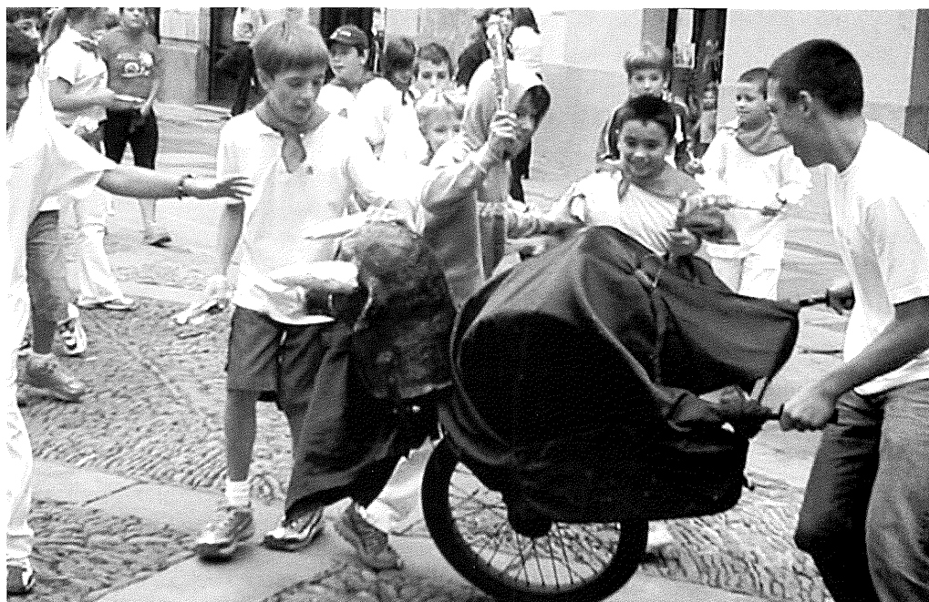
Uda Toperako gazteak San Fermin egunean

Uda etortzeaz batera, ume eta gazteek protagonismo apartekoa hartzen dute, ekin-tzak egiteko sasoi ezin hobea da-eta. Eskaintza ere gero eta zabalagoa da. Hala bada, Berbaroko Guezan Ba! ume eta gazte taldeak, indar berriz jantzita, atek ireki dizkie haurrei, hain desio dituzten udalekuan uda ahaztezi-na igaro dezaten.