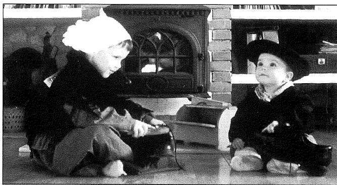
Hizkuntzaren transmisioan dago etorkizuna.